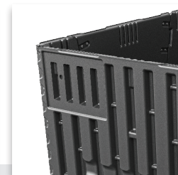
Termoformado de doble hoja