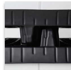
Patas de Tarima Entrelazables