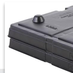
Diseño de Tapa