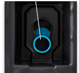
Seguro tipo Cacahuate